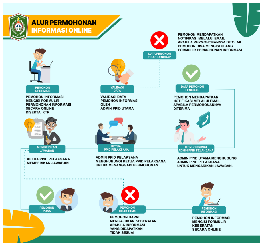
Gambar: 2.1 Alur Permintaan Informasi Kecamatan Rowokangkung Tahun 2025